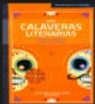
Calaveras Literarias I y II