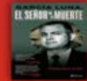
El señor de la muerte