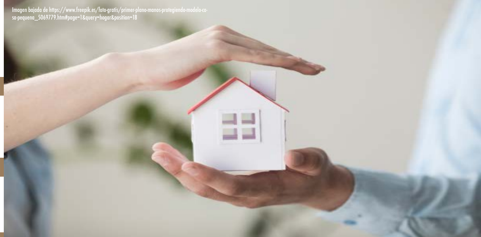
Imagen bajada de https://www.freepik.es/foto-gratis/primer-plano-manos-protegiendo-modelo-ca-sa-pequena_5069779.htm#page=1&query=hogar&position=18

* La UASLP solo funge como enlace con los establecimientos por lo que no tiene responsabilidad sobre las promociones efectuadas.