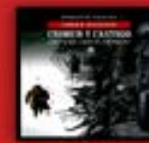
Crimen y castigo