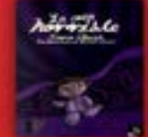
La casa horrible