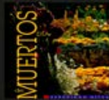
Día de Muertos