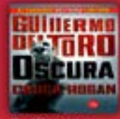
Guillermo del Toro