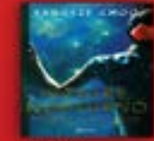
El tigre nocturno