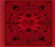
En casa con mis monstruos