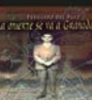
La muerte se va a Granada