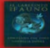
El laberinto del fauno