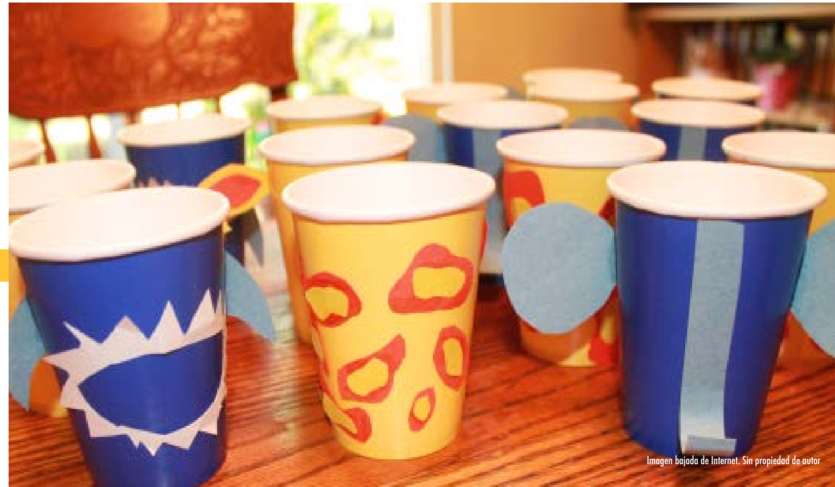
Imagen bajada de Internet. Sin propiedad de autor

10% de descuento en la compra de productos.