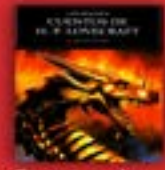
Cuentos de H.P. Lovecraft